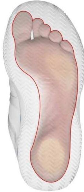
ARCO ALTO (SUPINATORE)