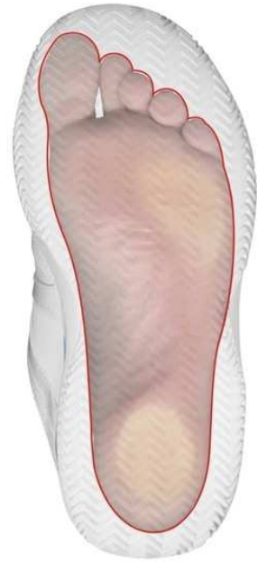
ARCO BASSO/PIATTO (IPERPRONATORE)