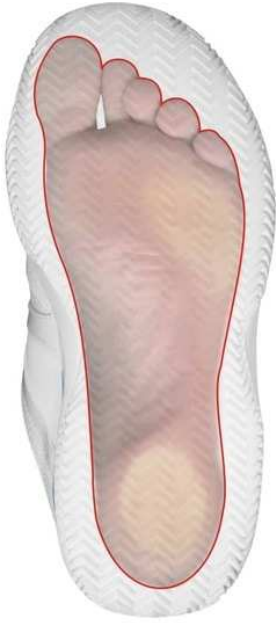
ARCO NORMALE (NORMALE PRONATORE)